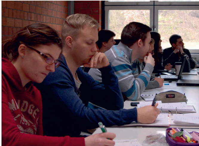
Arbeiten im Team ist Alltag für den CA

Der Consulting Assistant überbrückt die Wissens- und Leistungslücke zwischen den hoch qualifizierten Experten eines beratenden Unternehmens und seinen Assistenz- und Supportkräften. Auch in anderen Unternehmen kann der CA, z.B. im Vertriebswesen oder im Customer Relationship Management, vielfältige Aufgaben übernehmen.